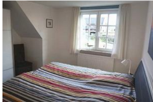
... mit gemütlichem Doppelbett ...