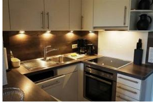
Die kleine Küche ist voll ausgestattet