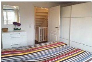
... und großem Kleiderschrank