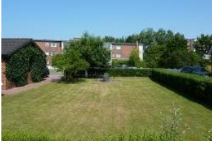
Das Wiesengrundstück, ideal für Kinder.