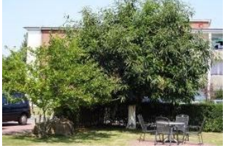
Der großzügige und beliebte Aussenbereich.