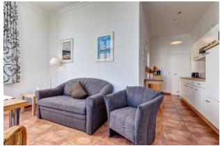
Wohnbereich mit Blick zur Küchenzeile