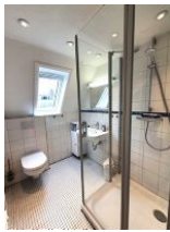
Das helle Duschbad bietet genügend Platz für die ganze Familie.