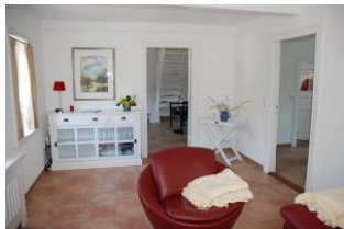
....mit gemütlichem Sessel !