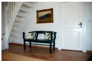
Der Eingangsbereich im Haus

Ihr Traum wird wahr. ! Das Ilkes Hus wurde komplett saniert und renoviert, teilw. neu eingedeckt und ist heute ein Ferienhaus, wie man es sich wünscht: ein altes Reetdachhaus mit modernem Komfort. Es wurde mit sehr viel Liebe zum Detail eingerichtet und verspricht Wohlgefühl. Große, freundliche Räume bieten einer sechs - köpfigen Familie Raum für einen gelungenen Urlaub. Treten Sie ein und lassen sich verzaubern..... Um dem Klimagedanken zu folgen, verfügt das Ilkes Hus auch über eine Ladestation für E-Autos (ABL eMH1)