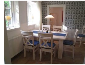
Frühstück mit Sonne - herrlich