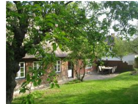
Der großzügige Garten hinter dem Haus, herrlich eingewachsen