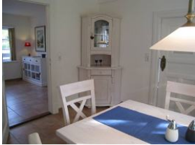
Vom Esszimmer kann man auch ins Wohnzimmer gehen.