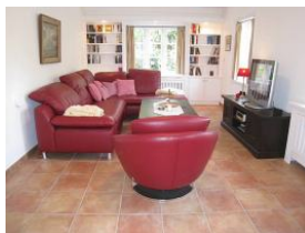
Das große Wohnzimmer...