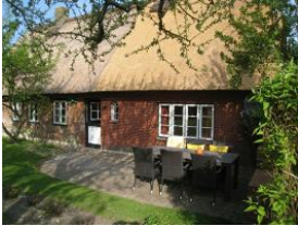
Die Terrasse hinter dem Haus - völlig ungestört