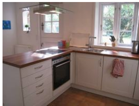
Die sep. Küche mit Winkelzeile