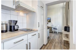
Blick aus der offenen Küche zum Essbereich