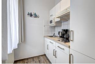
Blick in die Küche