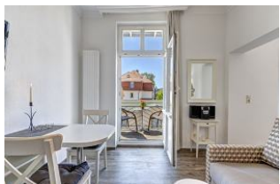
Wohnbereich mit Blick zum Balkon