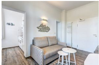
Wohnzimmer mit Blick ins Schlafzimmer