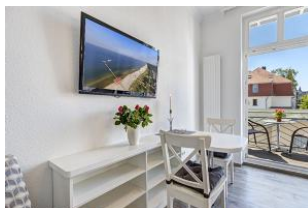
Essbereich mit Blick zum Balkon