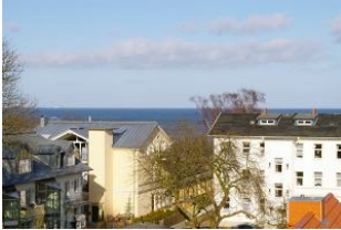
Seeblick vom Balkon