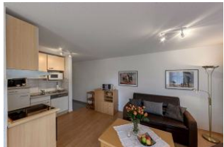
Küche und Wohnbereich