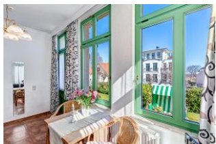
Essplatz mit Blick zur Terrasse mit Strandkorb

STRANDNAH! Nur ca. 100 m zur Strandpromenade mit TERRASSE, KLEINEM GARTEN und STRANDKORB! Gemütliches 2-Zimmer-Apartment mit freundlicher Ausstattung. Separates Schlafzimmer, Wohnzimmer mit Schlafcouch, Küchenzeile, Essplatz, geräumiges Duschbad, Terrasse mit Gartenmöbeln und STRANDKORB (Frühling bis Herbst) und kleinem Gartenstück, separater Eingang. Die Wohnung verfügt über einen Pkw-Stellplatz . Abstellraum für Fahrräder und ähnliches ist vorhanden. Eine Sauna in der "Villa Germania" kann kostenpflichtig genutzt werden. Vom Haus aus können Sie das Ortszentrum und die bekannte Ahlbecker Seebrücke in ca. 3 bzw. 5 Minuten zu Fuß erreichen.