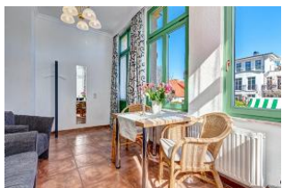
Essen und Wohnen