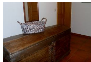
Eingangsbereich in die Wohnung