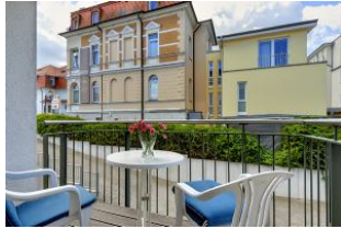
Balkon nach Süden