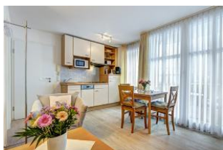
Küche, Wssen, Wohnen

1. Reihe, direkt an der Strandpromenade mit SÜDBALKON! FAHRSTUHL im Haus! Schönes 2-Zimmer-Apartment mit moderner guter Ausstattung. Separates Schlafzimmer (mit Fernseher), Wohnzimmer mit Küchenzeile mit Essplatz, Duschbad, Balkon zur Südseite mit Sonne bis abends. Die Wohnung verfügt über einen Pkw-Stellplatz. In der Garage können auch Fahrräder und ähnliches untergestellt werden. Von der "Villa Aquamarina" aus können Sie das Ortszentrum und die bekannte Ahlbecker Seebrücke in ca. 3 Minuten zu Fuß erreichen. Zum Strand sind es 50 m.