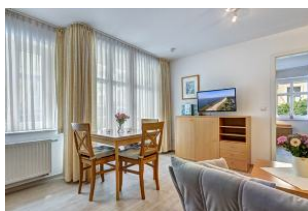
Wohnen, Essen, Blick zum Schlafzimmer