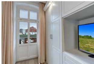
Flachbildfernseher im Schlafzimmer