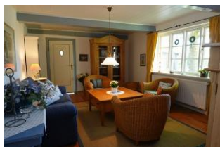
Das gemütliche Wohnzimmer