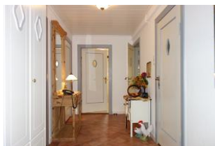
...treten Sie ein...