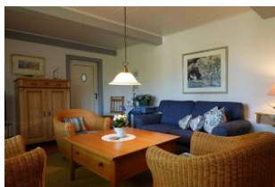
Eine Couch, drei Sessel - gemütlicher gehts kaum