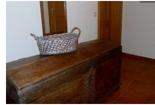
Eingangsbereich in die Wohnung