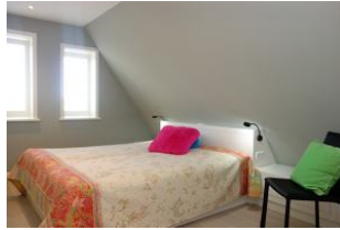
Das zweite Schlafzimmer. ebenfalls mit großem Doppelbett 180x200cm ohne Fussteil (nicht im Bild, das TV Gerät)