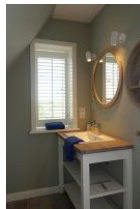
Das kleine, aber feine dazugehörige Bad, ebenfalls vom Schlafzimmer aus zu begehen