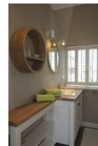
...und das dritte Bad...