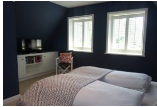
Einbaukommode und TV Gerät