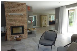
Der Blick Richtung Küche...