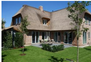
Die herrliche Terrasse. Hier dürfen Sie den Tag beginnen.....