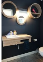
Das Gäste-WC im Erdgeschoss