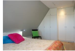
...und großem Einbauschrack.