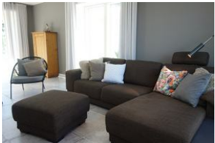
die Couchecke für lange Klönabende ....