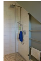
...mit großzügiger, bodengleicher Dusche