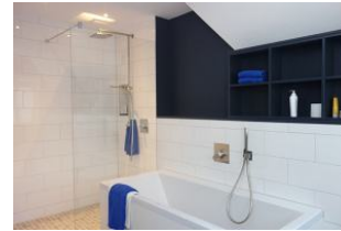
...mit Badewanne und großzügiger, bodengleicher Dusche