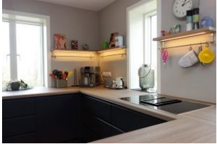
...benutzerfreundlich mit Schubladen.