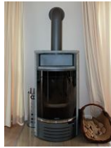
Der schöne Kaminofen für kuschelige Abende