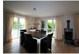
Der große Essbereich für gemeinsame Stunden