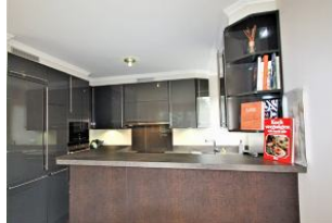
Die voll ausgestattete Küche mit Tresen ...