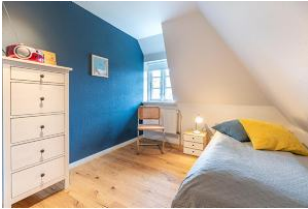
Schlafzimmer mit Einzelbett