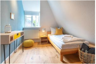
Schlafzimmer mit Einzelbett