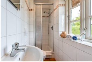
Bad im EG