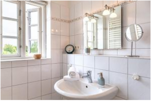
Badezimmer im OG mit Dusche