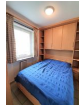
Das Schlafzimmer mit kleinem Doppelbett