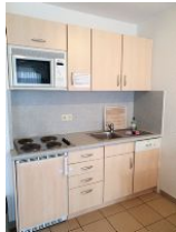
Die Küche ist nicht groß, aber gut ausgestattet.