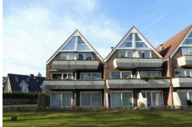
Das Haus von außen