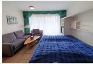
Das Schrankbett bietet Platz für 2 Personen.