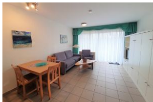
Der Wohnraum mit direktem Ausgang auf die eigene Terrasse.