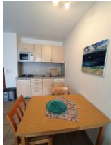
Der Wohnraum mit integrierter Küchenzeile.

Die Ferienwohnung Strandläufer liegt in einer bevorzugten Lage von Wyk . Ruhig und doch zentral , fußläufig zur Promenade, der Innenstadt, dem Wellenbad mit seinen Kureinrichtungen oder zum Südstrand. Die kleine Wohnung ist für bis zu 3 Personen ausgelegt . Sie ist liebevoll ausgestattet und hat ein kleines separates Schlafzimmer mit einem kleinen Doppelbett ( 140/ 190) und einem Schrankbett im Wohnbereich ( 2 X 80 / 190). Der Wohn- Ess- Bereich hat eine offene, voll ausgestattete Küche und einen direkten Ausgang auf die eigene Süd- Terrasse. Sie finden in dieser Wohnung ein modernes Duschbad mit Toilette zur täglichen Hygiene. Hier macht Urlaub Spaß.