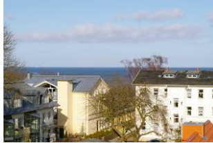
Seeblick vom Balkon