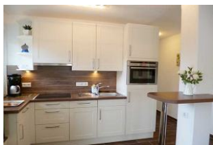
Die komplett ausgestattete Küche verfügt über Geschirrspüler/ Mikrowellenkompaktbackofen, Espresso Maschine von Tchibo und 4 Fach Touch-Feld Glaskeramikherd.