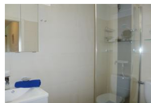
Das Badezimmer mit Handtuchwärmer und barrierefreier Dusche ist modern und hell gefliest.