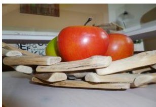
Hier macht das Kochen auch im Urlaub Freude.