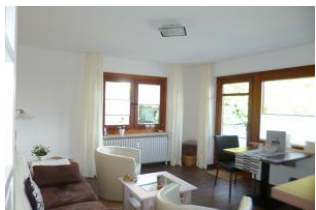
Vom Wohnzimmer haben Sie einen direkten Zugang zum Balkon.

Diese helle gemütlich eingerichtete 2-Zimmer-Ferienwohnung mit möbliertem Balkon befindet sich in ruhiger, aber zentraler Lage im 1. Obergeschoss in der Feldstraße 18 in Wyk. In dieser Nichtraucher Wohnung ist das Mitbringen von Haustieren nicht erlaubt. Diese Wohnung bietet einen Boden in Holzoptik, synthetische Bettwäsche und ist für Allergiker geeignet. Ein Treppenlift steht im Hausflur zur Verfügung!