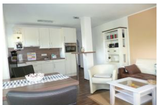
TV mit Flachbildschirm, WLAN sowie eine Stereoanlage mit CD gehören zur Ausstattung.