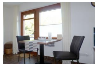
Direkt am Fenster zum Balkon befindet sich der Essplatz mit Blick ins Grüne.