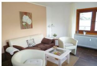
Das gemütliche Sofa lädt zu herrlichen Abenden ein.