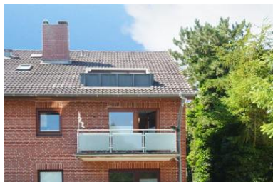
Die Unterkunft befindet sich im 1.OG.

Gemütliche Nichtraucher OG-Wohnung mit möblierten Balkon und Treppenlift im Hausflur.