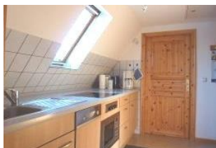
Ihre voll ausgestattete Küche lässt keine Wünsche offen.