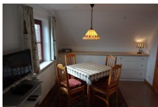
Ihr heller Sitzplatz.