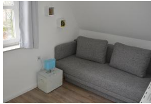
zweites Schlafzimmer mit Ausziehcouch und Schrankbett