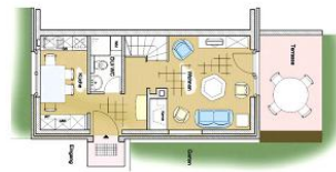
Grundriss Erdgeschoss - Küche, Bad, Wohnzimmer