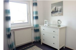
Kommode für Kleidung, Spielsachen etc.