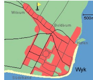
Entfernungen, zirka: zum Bäcker 100 m, zur Einkaufsmöglichkeit 3,0 km, zum Flugplatz 4,0 km, zum Golfplatz 4,2 km, zum Hafen 3,5 km, zum Meer 3,5 km, zum ÖPNV 100 m, zum Badestrand 3,5 km, zum Ortszentrum 100 m