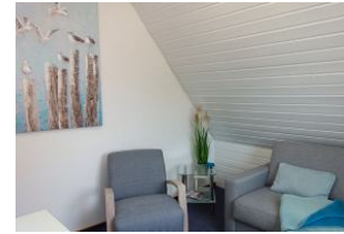
...und gemütlichem Sessel für ein Lesestündchen ?