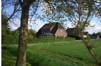
Das Haus Hardesweg 9