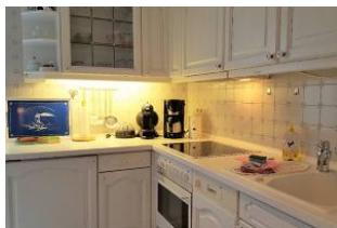
In dieser Küche macht das Kochen Spaß. Die Terrasse ist von hier direkt begehbar.