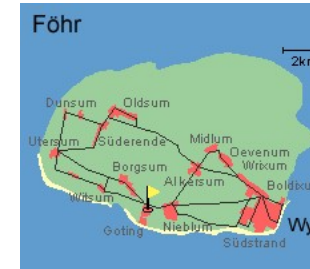
Entfernungen, zirka: zum Badestrand 400 m