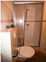
Das helle Duschbad...