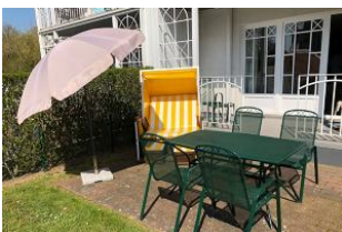
Der Garten ist eingezäunt.