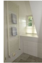
Auch hier die Handtuchheizung