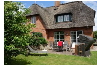
Die Terrasse mit Tisch und Stühlen, Liege, Strandkorb und.....viel Sonnenschein