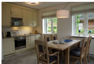
...der großzügige Esstisch...nehmen Sie Platz.