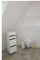
...und die Toilette