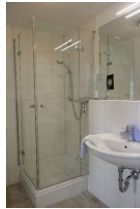
Das Duschbad im Obergeschoß, vom Elternschlafzimmer aus zu begehen.