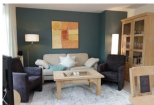
Harmonische Farben, gemütliche Couch und Sessel...