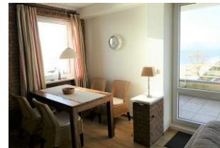
Der Essbereich mit Meerblick