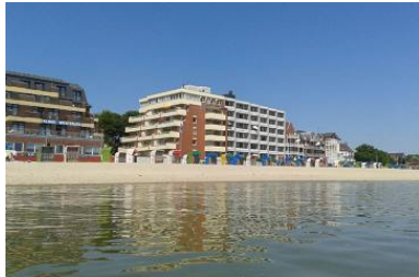
Das Haus von außen