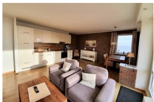
Das lichtdurchflutete Wohnzimmer mit offener Küche.

Diese traumhafte Ferienwohnung mit großartigem Meerblick befindet sich im 4. OG und ist für max. vier Personen ausgelegt. Die ca. 70 qm große Wohnung ist mit einem Fahrstuhl ganz bequem zu erreichen. Sie verfügt über zwei Schlafzimmer und einen sehr gemütlichen Wohn - Ess- Bereich mit offener und vollausgestatteter Küche. Auf dem Balkon wartet ein schöner Strandkorb auf Sie. Die Promenade und die Innenstadt sind nur einen Katzensprung entfernt. Sie wohnen ruhig und sehr zentral. So macht der Urlaub Spaß.