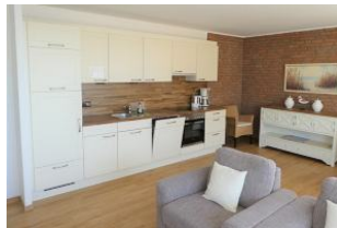
Die moderne und gut ausgestattete Küche