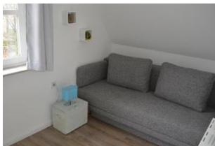
zweites Schlafzimmer mit Ausziehcouch und Schrankbett