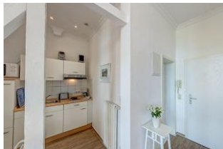
Küche / Eßplatz / links großer Balkon