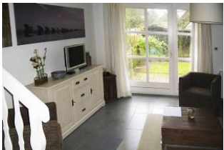
Ausgang zum gemütlichen Gartenteil

Verbringen Sie Ihren Urlaub in einem Haus in dem es Ihnen an nichts fehlen wird. Unser Hausteil bietet Ihnen ca. 60qm Wohnfläche auf 2 Etagen, einen separaten Eingang sowie einen eigenen Garten. Nieblum ist das schönste Dorf der Insel. Den historischen Ortskern erreichen Sie in 3 Minuten und zum Strand gehen Sie gemütlich ca. 10 Min. Im Sommer wie auch im Winter können Sie sich in unserem Haus wohlfühlen. Die Fußbodenheizung und der offene Kamin sorgen für eine gemütliche Atmosphäre.