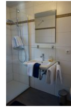
Das kleine Duschbad im Erdgeschoß