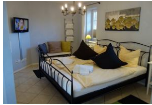
Großes Schlafzimmer im Erdgeschoß mit Doppelbett und zus. TV-Gerät