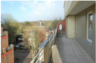
Der Blick vom Balkon auf die Wyker Mühle