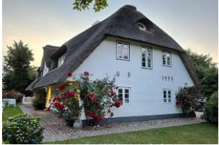
Haus vom Garten aus