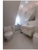
Badezimmer mit Dusche