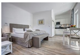
Wohn- und Schlafräum