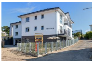
Essplatz und Küchenzeile