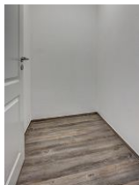
Abstellraum für Koffer, etc.