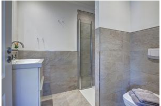
Bad mit Dusche