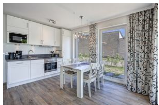
Essplatz und Küche