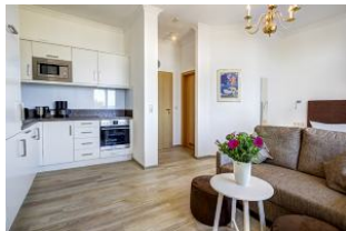
Blick zum Flur und zur Badtür