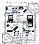
Wohnungsgrundriss (Möblierung exemplarisch)

STRANDNAH, GROSS, MODERN! Mit 2 BALKONEN (je ca. 11 qm), FAHRSTUHL, SAUNA und nur ca. 100 m zur STRANDPROMENADE! Großzügige elegante 4 - Zimmer - Wohnung mit sehr guter Ausstattung! 3 separate Schlafzimmer, 3 Bäder (2 davon ensuite), alle mit Fußbodenheizung. Die ensuite-Bäder verfügen über Wanne und Dusche bzw. Dusche. Das dritte Bad ist ein Saunabad mit Saunakabine und Schwalldusche. Der große Wohnbereich verfügt über eine vollausgestattete Küchenzeile, einen Eßbereich und einen Couchbereich mit KAMINOFEN. Die Balkone sind möbliert. Zur Wohnung gehört ein STRANDKORB AM STRAND. Die Wohnung verfügt über einen Pkw-Stellplatz in der teilüberdachten Tiefgarage. Fahrradabstellfläche ist vorhanden. Vom Haus aus können Sie das Ortszentrum und die bekannte Ahlbecker Seebücke in ca. 2 Minuten zu Fuß erreichen.