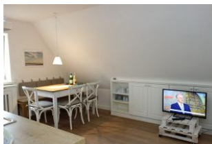
Das TV Gerät darf natürlich nicht fehlen