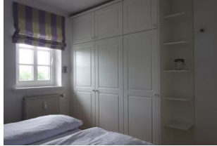
... und Einbauschranks, der alle Kofferinhalte aufnehmen kann.