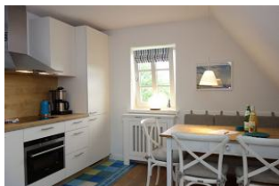
Der Esstisch mit Bank und drei Stühlen