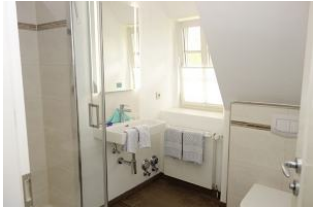
Das Bad mit Waschtisch, Dusche und Toilette