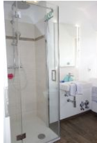
Die neue Duschkabine, flacher Einstieg