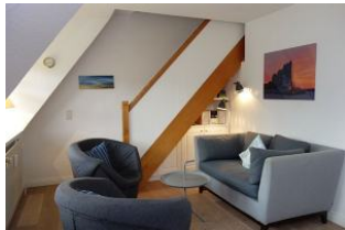
Gemütliche Sitzecke mit kleiner Couch und zwei Sesseln

Komfortable, in warmen Farben eingerichtete OG-Wohnung für 2-4 Personen. Auf halbem Weg zwischen Wyk und Nieblum steht dieses Reetdachhaus mit 4 Wohneinheiten. Wer die Ruhe sucht, den weiten Blick über Pferdekoppeln liebt, wohnt hier genau richtig. Das Meer ist so nah, man kann es fast riechen. Ideal auch für Golfer, denn der Golfplatz ist zu Fuß erreichbar.