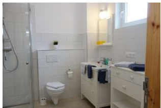
...das neue Bad mit genügend Abstellfläche und ...