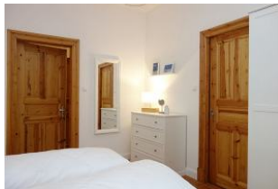
...Kommode und Ganzkörperspiegel...