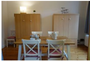
...hier die beiden Schrankbetten von denen jede Matratze 110cm in der Breite misst. Tisch beiseite geschoben und fertig ist das zweite Schlafzimmer.