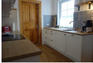
...die rechte Küchenzeile die Spüle, Kaffeemaschine und vieles mehr...