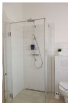
... großer, ebenerdiger Dusche.