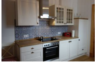
...die linke Küchenzeile beherbergt Ceranfeld/Backofen und den Kühlschrank...