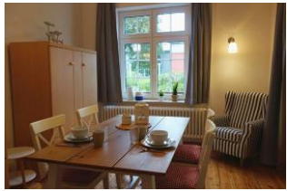
...ein sep. Esszimmer findet man selten, auch gut als Leserückzugsort geeignet...