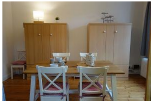
...hier die beiden Schrankbetten von denen jede Matratze 110cm in der Breite misst. Tisch beiseite geschoben und fertig ist das zweite Schlafzimmer.