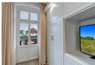
Flachbildfernseher im Schlafzimmer