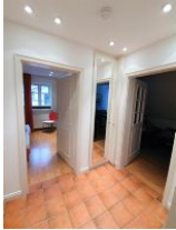
Der Eingangsbereich der Wohnung.