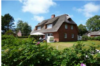
Gemütliches Endreihenhaus unter Reet in Nieblum, Bi de Süd 17.

Die Unterkunft verteilt sich über EG und 1.OG.