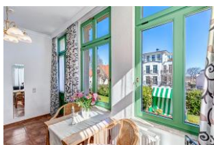
Essplatz mit Blick zur Terrasse mit Strandkorb

STRANDNAH! Nur ca. 100 m zur Strandpromenade mit TERRASSE, KLEINEM GARTEN und STRANDKORB! Gemütliches 2-Zimmer-Apartment mit freundlicher Ausstattung. Separates Schlafzimmer, Wohnzimmer mit Schlafcouch, Küchenzeile, Essplatz, geräumiges Duschbad, Terrasse mit Gartenmöbeln und STRANDKORB (Frühling bis Herbst) und kleinem Gartenstück, separater Eingang. Die Wohnung verfügt über einen Pkw-Stellplatz . Abstellraum für Fahrräder und ähnliches ist vorhanden. Eine Sauna in der "Villa Germania" kann kostenpflichtig genutzt werden. Vom Haus aus können Sie das Ortszentrum und die bekannte Ahlbecker Seebrücke in ca. 3 bzw. 5 Minuten zu Fuß erreichen.