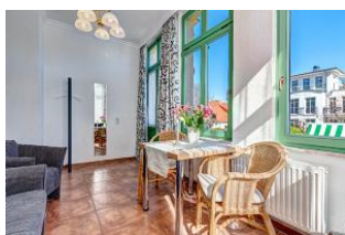
Essen und Wohnen