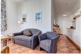
Wohnbereich mit Blick zur Küchenzeile