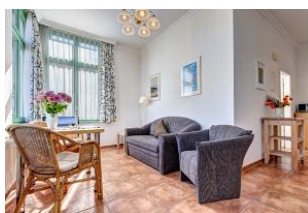
Essen und Wohnen