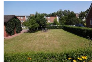
Der herrliche Außenbereich.