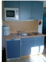
Die Küchenzeile, ausgestattet mit 2-Platten-Ceran-Kochfeld, Mikrowelle und einem Kühlschrank mit Gefrierfach.