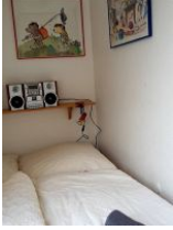
Blick ns 2. Schlafzimmer mit einem 1,40 m Bett