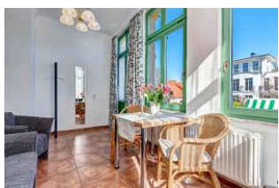
Essen und Wohnen