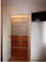
... und begehbarem Kleiderschrank für das Urlaubsgepäck