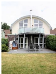
Das architektonisch einmalige Haus von außen.