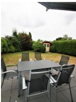
Die schöne Terrasse mit dem eigenen kleinen Garten