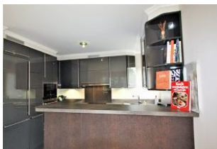
Die voll ausgestattete Küche mit Tresen ...