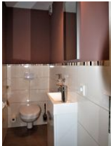
Das kleine und separate Gäste-WC