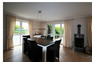
Der große Essbereich für gemeinsame Stunden