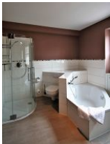
... mit Dusche und Badewanne