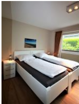
Das zweite Schlafzimmer mit zwei Einzelbetten ...