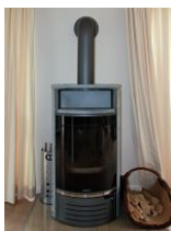
Der schöne Kaminofen für kuschelige Abende