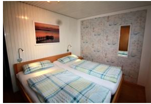
Hier sehen Sie das zweite Schlafzimmer.

Entfernungen, zirka: zum Bäcker 800 m, zur Einkaufsmöglichkeit 800 m, zum Meer 500 m, zum Ortszentrum 800 m