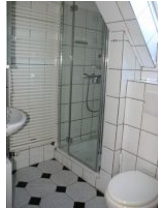
Das Badezimmer mit Dusche.