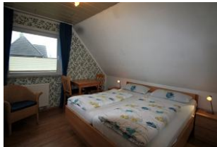
In dem ruhigen und beschaulichen Örtchen Utersum finden Sie in den schönen Schlafräumen einen erholsamen Schlaf.

Entfernungen, zirka: zum Bäcker 800 m, zur Einkaufsmöglichkeit 800 m, zum Meer 500 m, zum Ortszentrum 800 m