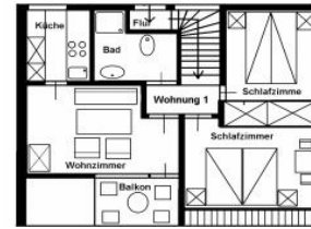
Der Grundriss der Wohnung.