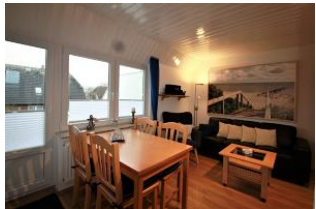
Das gemütliche und helle Wohnzimmer mit der integrierten Essecke lädt zum Verweilen ein.

Das Haus "Pidder Lyng"- gelegen in Utersum - bietet Ihnen alles, was Sie sich für einen erholsamen Urlaub wünschen können. Das Dorfzentrum befindet sich nur 800 Meter entfernt und der schönste Strand der Insel ist in wenigen Gehminuten erreichbar. Die helle und sonnige Ferienwohnung ist eine Dachgeschosswohnung mit Balkon. Durch die zwei Schlafzimmer, dem hellen Wohnraum mit gemütlicher Essecke, der separaten Küche und dem Badezimmer mit Dusche findet sich genügend Platz für einen Urlaub mit 4 Personen. Die hervorragende Ausstattung der Wohnung lässt keine Wünsche offen.