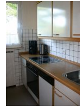
In der separaten, vollausgestatteten Küche mit Backofen, Geschirrspüler und Mikrowelle macht das Kochen richtig Spaß.