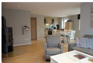
Der gemütliche Sitzbereich mit Blick zum Esstisch und zur Küche. Platz.