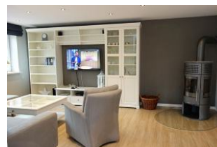
Herrlich ....ein Ofen. Holz gibts im REWE-Markt