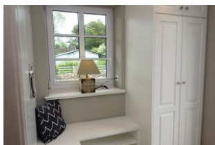
Treten Sie ein, ein kleiner Flur mit Sitzbank erwartet Sie...